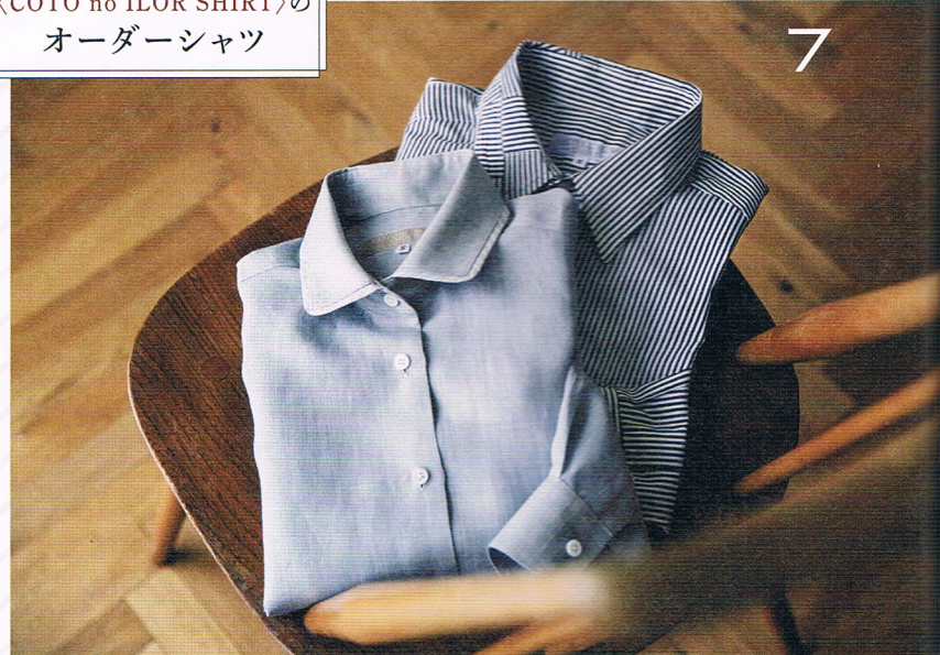
〈COTO no ILOR SHIRT〉の オーダーシャツ

アルファベットや漢字で記念日や名前を刻んだお箸を、特別な日のギフトに。オリジナリティのある1膳が作れる。けずり箸黒金線2,800円(桐箱480円)、亀甲塗分箸赤2,000円、オリジナル名入れ加工は1膳600円