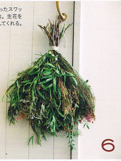
〈Vestita〉の オーダースワッグ

季節の花やグリーン、ハーブなどをたっぷり使ったスワッグは、ドライになっていく経過を楽しめるのも魅力。生花を中心に、好みやリクエストに応じたアレンジを施してくれる。オーダー 2,000円～ (写真は5,000円のもの)