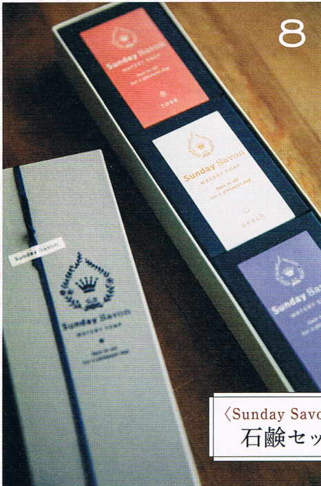
〈Sunday Savon〉の 石鹸セット

播州織を中心とした約300種類の生地、襟の形といったベースだけでなく、ボタンやステッチに至るまで細かくオーダー可能。好みを色濃く反映した最愛の1枚に出会える。写真のシャツはメンズ21,000円、レディース19,200円