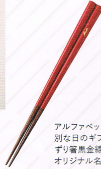
〈神戸箸屋〉の 名入れ箸